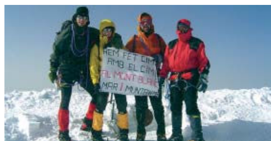
Els quatre membres del CIM van trigar quatre dies a pujar el Mont-Blanc | EL CIM