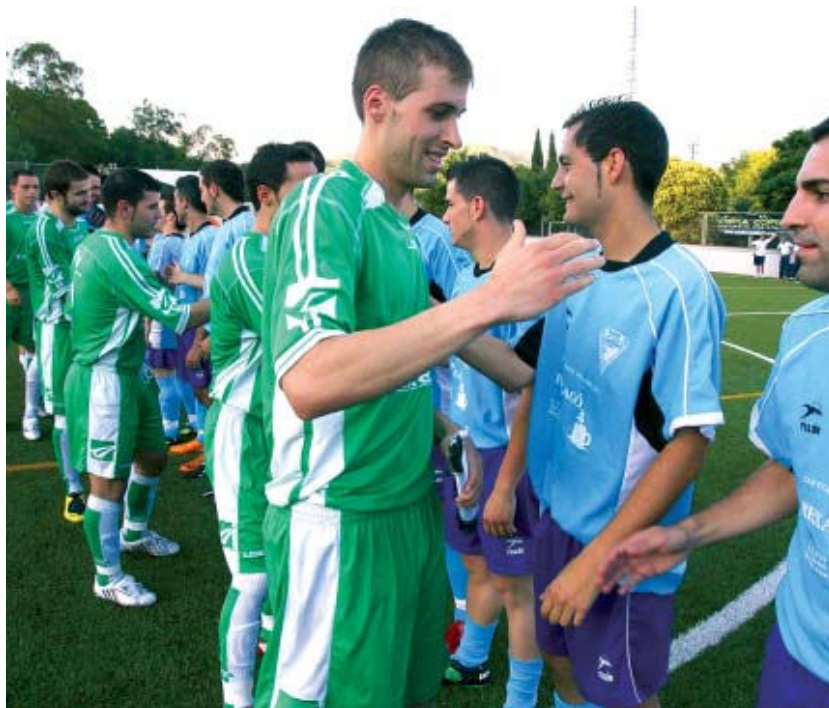
Amb motiu de la Festa Major, el CD Montcada va visitar el camp de Can Sant Joan per jugar un amistós i acomiadar la temporada

Després d'aquest matx, tots dos equips ja estan de vacances i tornaran a la competició amb l'inici de la pretemporada. El CD Montcada, amb la plantilla ja tancada amb 12 incorporacions, reemprendrà els entrenaments el 28 de juliol, amb sessions de dilluns a divendres a l'estadi de la Ferreria. El club ja ha tancat les dates per jugar quatre amistosos. El 30 d'agost es farà la presentació i es jugarà un partit amb un rival encara per determinar. El Mataró i l'Hospitalet, tots dos equips de Tercera Divisió, seran dos dels rivals dels montca-