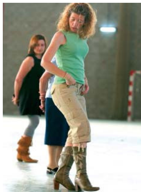
Els participants aprenen les directrius bàsiques d'aquest ball | SANTI ROMERO

L'Institut Municipal d'Esports i Lleure (IME) organitza un any més el curs de country, una de les activitats consolidades dins del programa estiuenc. El curs s'imparteix des del dia 18 de juny i fins al 23 de juliol a la Zona Esportiva Centre. L'activitat es fa els dilluns i dimecres, de 19 a 20.30h. | NS