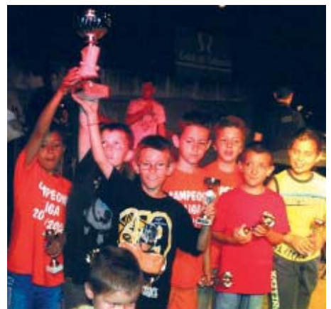
Tots els jugadors de l'entitat van rebre un trofeu

Un total de 18 equips va participar a la diada de bàsquet al carrer que va tenir lloc el 19 de juny a la plaça del Bosc de Can Sant Joan. L'activitat la van organitzar l'Institut Municipal d'Esports i Lleure (IME) i el CEB Can Sant Joan. La propera jornada de bàsquet es farà el 10 de juliol a la plaça de l'Església, en aquesta ocasió promoguda per l'IME i el CB Montcada. Les inscripcions es poden fer a les oficines de l'IME, al carrer Tarragona, 32, de dilluns a dijous, de 9 a 13h, i de 17 a 19h, fins al dia 5. El preu de la inscripció és de 4 euros per equip | NS