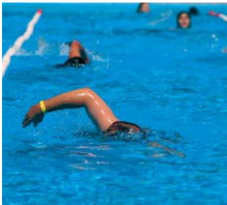
L'any passat Montcada va nedar 38.000 metres per l'esclerosi

plaça de l'Església i en el mateix lloc hi haurà una marató d' spinning , el 22. Les inscripcions estaran obertes fins al 10 de juliol per a l'aeròbic i fins al 17 per a l' spinning . Finalment, el 13 de juliol hi haurà una nova edició del 'Mulla't' per l'esclerosi múltiple a la piscina municipal de la Zona Esportiva Centre.