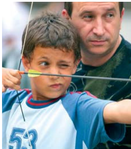
Els participants van provar la punteria amb el tir amb arc | SANTI ROMERO

Al voltant de cent-cinquanta persones van participar a la diada de tir amb arc que l'Institut Municipal d'Esports i Lleure (IME) va organitzar l'1 de juliol a la plaça de l'Església. Un any més, aquesta activitat va tenir molt bona participació, sobretot entre els més petits. L'acte va comptar amb el suport del Club Català de Tir amb Arc Can Piqué. Els participants van posar a prova la seva punteria amb figures d'animals en tres dimensions. Des de l'altre cantó de la línia, els monitors i els arquers indicaven les directrius que s'havien de seguir i ensenyaven els infants a tirar amb l'arc. Els participants van poder gaudir d'una bona tarda afinant la punteria | NS