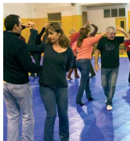
Els participants poden aprendre diverses disciplines | SANTI ROMERO

Per segon any consecutiu, l'IME ofereix un curs de balls caribenys que engloba diverses disciplines com el tra-ba-bà, la batxata, el merengue, la salsa i el forró i tot tipus de disciplines procedents de zones càlides i caloroses. El curs s'imparteix els dimarts i els dijous, de 21.30 a 23.30h, a la Zona Esportiva Centre fins al 22 de juliol | NS