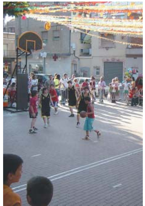
El 3x3 de Can Sant Joan va tenir una elevada participació | SANTI ROMERO

Un total de 18 equips va participar a la diada de bàsquet al carrer que va tenir lloc el 19 de juny a la plaça del Bosc de Can Sant Joan. L'activitat la van organitzar l'Institut Municipal d'Esports i Lleure (IME) i el CEB Can Sant Joan. La propera jornada de bàsquet es farà el 10 de juliol a la plaça de l'Església, en aquesta ocasió promoguda per l'IME i el CB Montcada. Les inscripcions es poden fer a les oficines de l'IME, al carrer Tarragona, 32, de dilluns a dijous, de 9 a 13h, i de 17 a 19h, fins al dia 5. El preu de la inscripció és de 4 euros per equip | NS