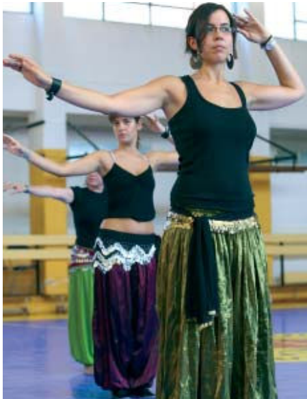
La dansa oriental ob té molta bona acollida entre les noies joves | SANTI ROMERO

Els cursos de dansa oriental repeteixen i guanyen participants dins de l'oferta esportiva d'estiu que organitza l'Institut Municipal d'Esports i Lleure (IME). Els balls s'imparteixen els dimarts i els dijous, de 20 a 21.30h, a la Zona Esportiva Centre. Aquesta activitat es fa per tercer any consecutiu i té molt èxit, sobretot, entre el públic juvenil. A les classes s'ensenya l'exotisme i els ritmes dels països asiàtics, una cultura desconeguda i propera alhora | NS