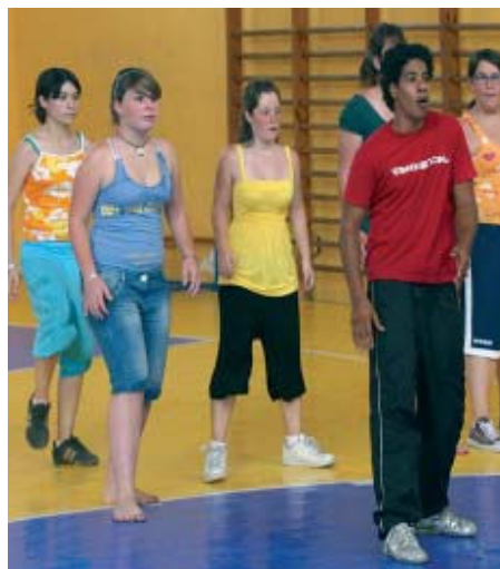
El curs de hip-hop ha tingut molt bona acollida entre les més joves

Per primer cop l'Institut Municipal d'Esports i Lleure (IME) ofereix un taller de hip-hop per a majors de 12 anys. Aquesta activitat és una de les novetats que s'emmarca dins del programa estiuenc. El taller de hip-hop es fa els dimarts i dijous, de 18.30 a 20h, al Gimnàs Municipal de la Zona Esportiva Centre des del 17 de juny fins al 22 de juliol. El taller compta amb la participació d'una vintena de joves que vol aprendre els passos d'aquesta disciplina provinents dels ritmes afroamericans i hispanoamericans | NS