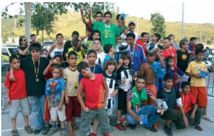
Els guanyadors de les tres categories del Mundialet de la Ribera van ser obsequiats amb medalles

El Mundialet de la Ribera, organitzat per la Taula Cívica i l'equip comunitari del barri en el marc del programa de dinamització social del Pla Integral de la Ribera, va celebrar el 27 de juny la fi del torneig. En un acte lúdic, els organitzadors van lliurar material esportiu, medalles i trofeus als tres equips guanyadors de cada categoria i una pilota per a tots els participants. A més, també es van atorgar guardons als porters menys golejats i als jugadors més anotadors de cada categoria. La festa, que va tenir lloc a la pista del barri amb una exhibició de ball de reggaeton inclosa, es va obrir amb un partit entre els capitans de tots els equips participants. El torneig ha estat un èxit tant d'implicació com de participació per